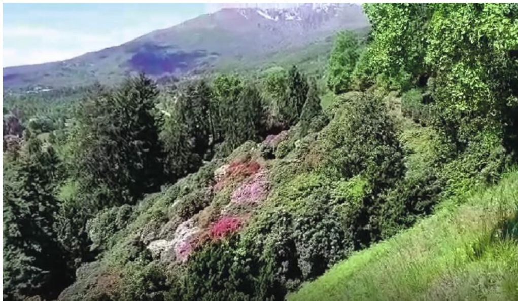
BURCINA IN QUESTI GIORNI La foto è tratta dal filmato del Parco Ticino sulle prime fioriture di questa settimana