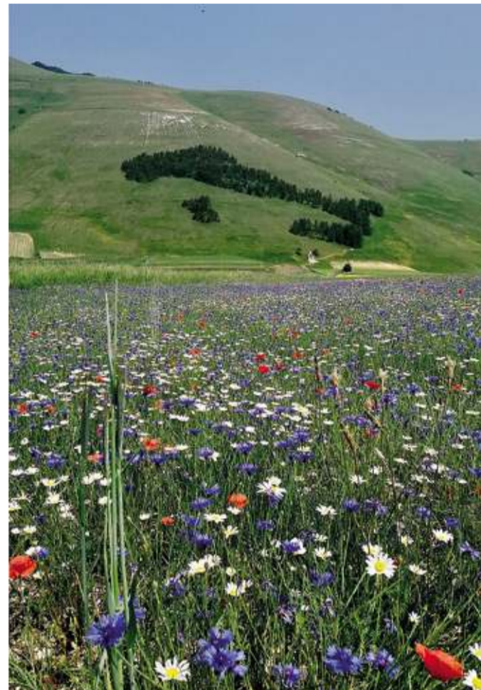
Piana di Castelluccio