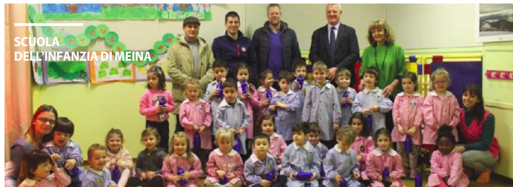
SCUOLA DELL'INFANZIA DI MEINA

MEINA Acqua da bere in comode borracce. La tutela e la cura dell'ambiente si impara fin da piccoli. Il messaggio è stato lanciato dall'Amministrazione comunale agli studenti delle scuole meinesi e frazione dell'infanzia di Meina e