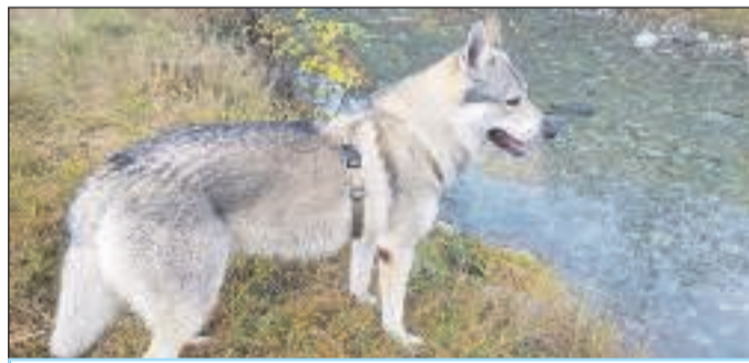
Una foto del cane Yago

I proprietari ora lanciano l'appello: «Se qualcuno lo avesse avvistato può contattare i seguenti numeri: 335.6274748 (Fabio) oppure 344.3833635 (Francesca)».