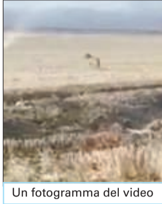
Un fotogramma del video