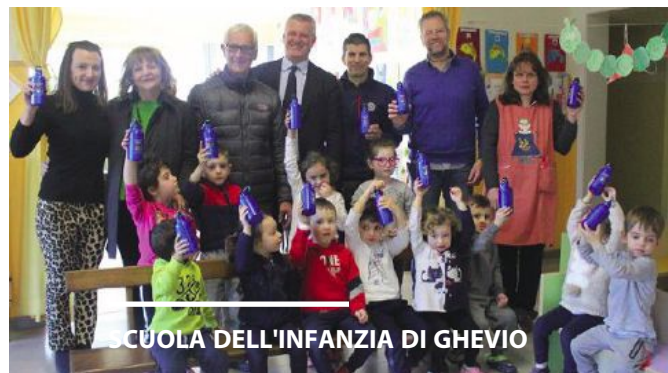
SCUOLA DELL'INFANZIA DI GHEVIO

Ghevio, alla scuola primaria e secondaria di primo grado per la distribuzione delle utili, e soprattutto ecologiche, borracce blu, con tanto di stemma del Comune. Se usate correttamente consentono di dire addio al-