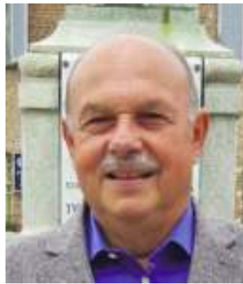
Il Sindaco di Desana Luigi Ferraris

stata ultimata una postazione coperta adiacente alla palestra polifunzionale affinché la Pro Loco possa avere una cucina per le manifestazioni a favore della cittadinanza. Se verrà concesso un ulteriore contributo sarà realizzata una ristrutturazione completa dell'edificio scolastico. È stata appoggiata alla società Maggioli Tributi la cura delle bollette non pagate, così da velocizzare il recupero degli insoluti».