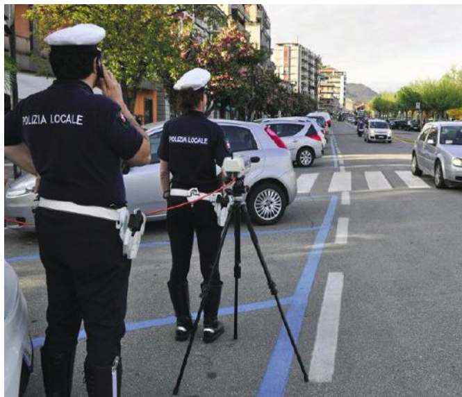
POLIZIA LOCALE Gli agenti durante i controlli

maggiore fluidità del traffico ottenuta con le recenti modifiche alla viabilità in via Cantoni, Turati e Mazzini» sottolinea il primo cittadino. Sono stati 9.804 gli accertamenti complessivi per violazione al Codice della strada, anche se nel bilancio non viene specificata voce per voce, come ad esempio violazioni accertate con autovelox o per non aver indossato le cinture. Non solo attività sulle strade tra i compiti degli agenti della polizia municipale: 11 gli allontanamenti per comportamenti molesti; 21 notizie di reato con deferimento all'autorità giudiziaria. Le sanzioni per violazioni al regolamento di Polizia urbana sono state 13; 46 le sanzioni amministrative di varia natura. 15 i sequestri di Polizia giudiziaria e amministrativi, 53 notifiche di polizia giu-